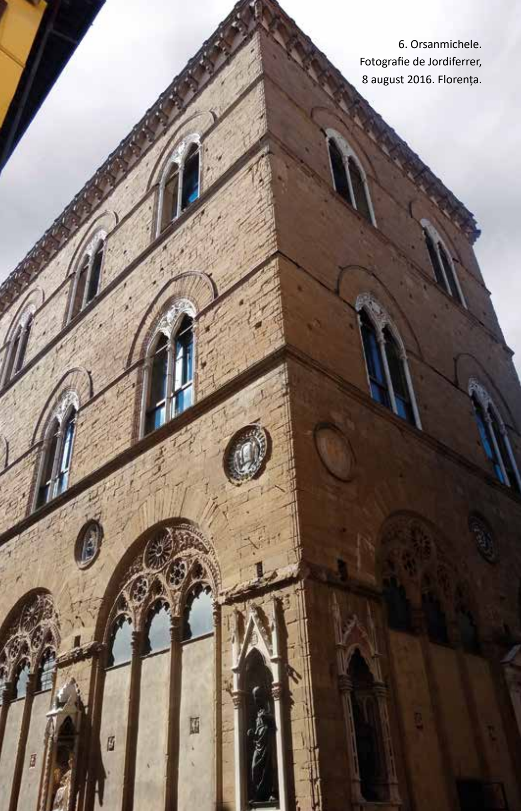
6. Orsanmichele. 8 august 2016. Florența.