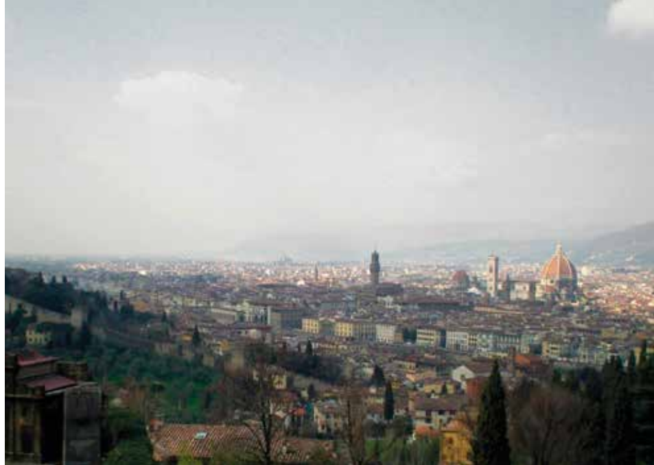
7. Priveștiște asupra Florenței dinspre San Miniato al Monte, 2010. Fotografia autorului. Florența.