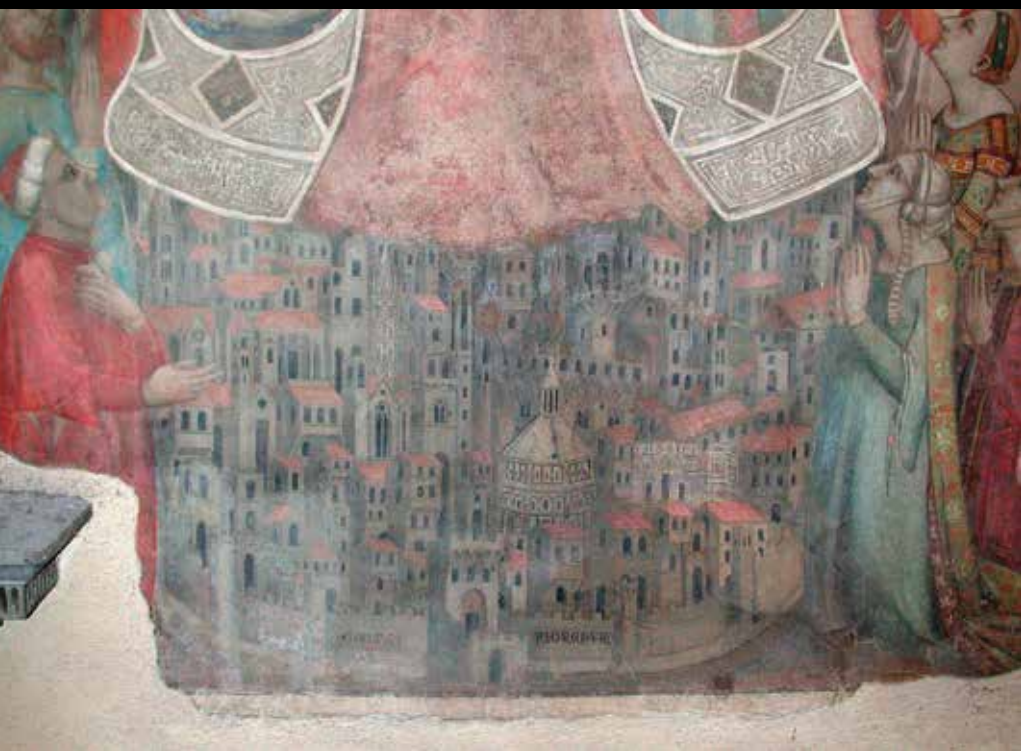
9. Madonna della Misericordia – detaliu al unei vederi panoramice asupra Florenței, c. 1340-1350. Frescă. Museo del Bigallo, Florența.