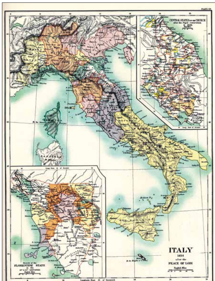
5. Reginald Lane Poole. Italia după Pacea de la Lodi (publicată inițial ca planșa 68 în The Historical Atlas of Europe ).