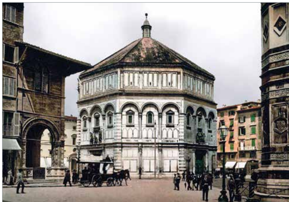
8. Baptisteriul din Florența, c. 1890-1900. Imprimare fotomecanică anonimă. Florența.